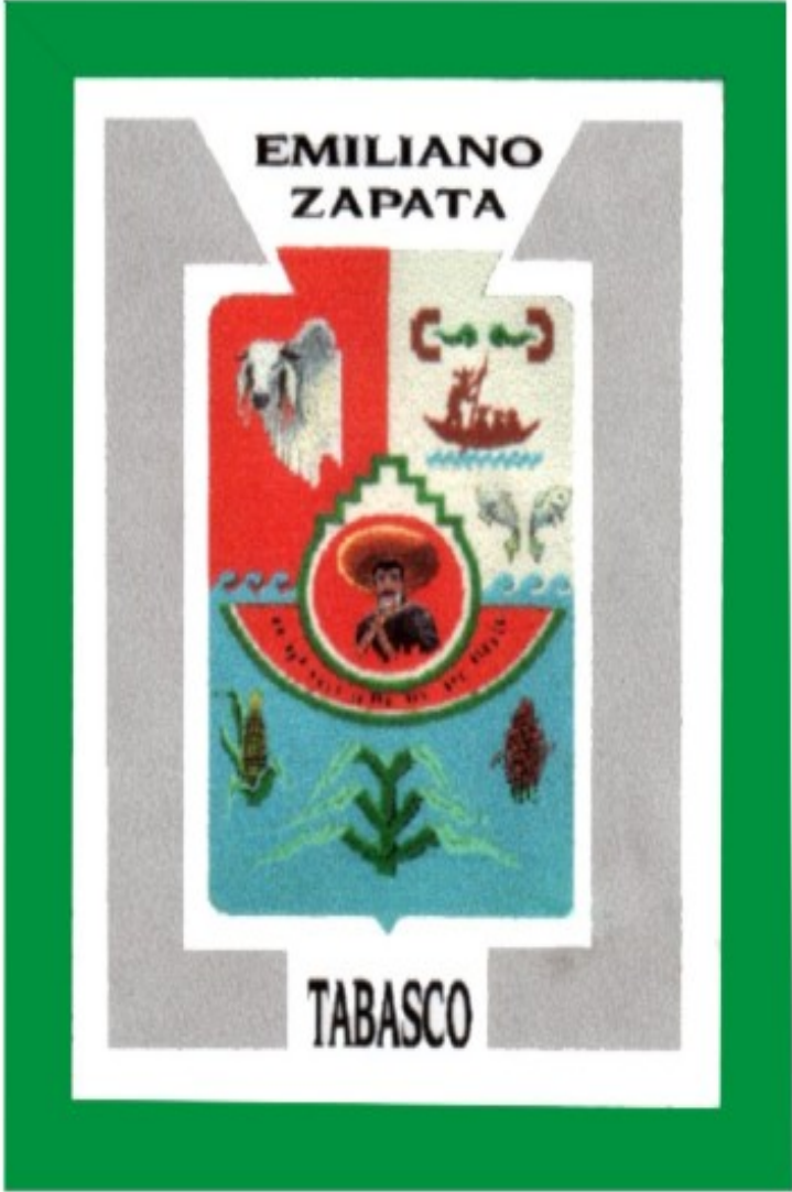
Emiliano Zapata, Enero de 2010